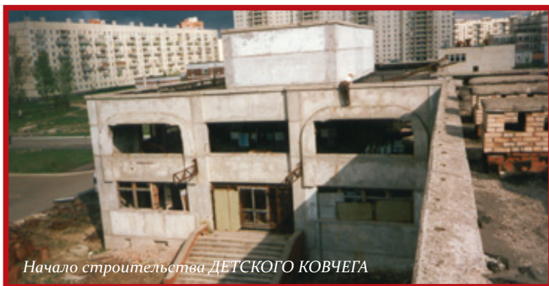
Начало строительства ДЕТСКОГО КОВЧЕГА